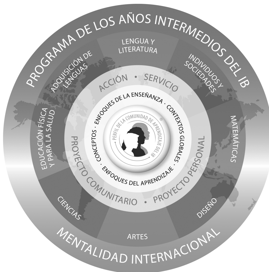
Figura 1 Modelo del Programa de los Años Intermedios

El PAI, destinado a alumnos de 11 a 16 años, proporciona un marco para el aprendizaje que anima a los alumnos a convertirse en pensadores creativos, críticos y reflexivos. El PAI hace hincapié en el desafío intelectual, y los estimula a establecer conexiones entre las disciplinas tradicionales que estudian y el mundo real. Fomenta el desarrollo de habilidades comunicativas, el entendimiento intercultural y el compromiso global, cualidades esenciales para los jóvenes que serán futuros líderes globales.